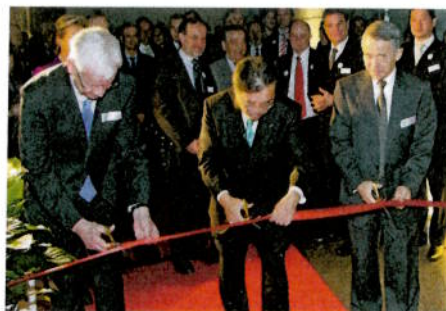
Dry Mouth Gel von GC Europe.

GC ist seit 90 Jahren innovativ und gibt Service und Produktverfügbarkeit mehr Raum